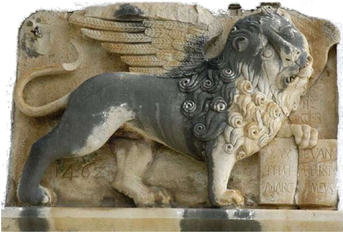
Lion of saint Mark at Lesina (Hvar) / Leone di san Marco a Lesina (Hvar)