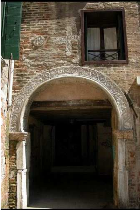
The arch in Corte del Milion and detail of the decorations above / L'arco in Corte del Milion e dettaglio delle decorazioni sovrastanti