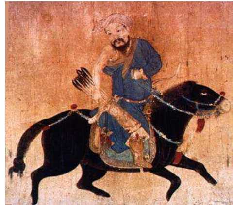
Mongol archer on horseback, Ming dynasty / Guerriero mongolo a cavallo, dinastia Ming

During the first half of the XIII century, the Mongols had been rapidly and bloodily expanding throughout central Asia, and even made incursions westward into Europe.