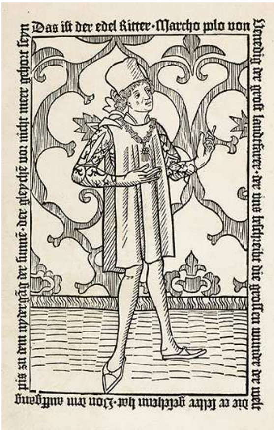
Imaginary portrait of Marco Polo from the frontispice of the first printed edition of his account, Nuremberg: Creussner, 1477 / Ritratti immaginario di Marco Polo dal frontespizio della prima edizione a stampa del suo resoconto, Nurnberg: Creussler, 1477

Chagadai (che a sua volta morì nel 1266) impedivano al momento la via diretta verso ovest. Si misero dunque su una lunga deviazione che li portò a Bucharà nell'Uzbekistan, ma vi rimasero poi bloccati per due anni. Era il 1264 quando un ambasciatore inviato da Hulagu a Khublai Khan li invitò a seguirlo a Khanbaluc per essere presentati a corte.