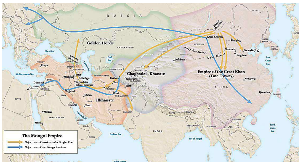
The Mongol empire at the time of Khublai Khan / L'impero mongolo al tempo di Khublai Khan at http://www.lacma.org/khan/map.htm (access / accesso 08.10.2013)

After Khublai's death in 1294, the khanates broke up in smaller, conflicting territories, but once settled and as long as it lasted, the Mongol empire was peaceful, tolerant, well-organised and open to technical progress, with a well-maintained net of canals, roads and relay stations like had not been seen in Europe since Roman times.