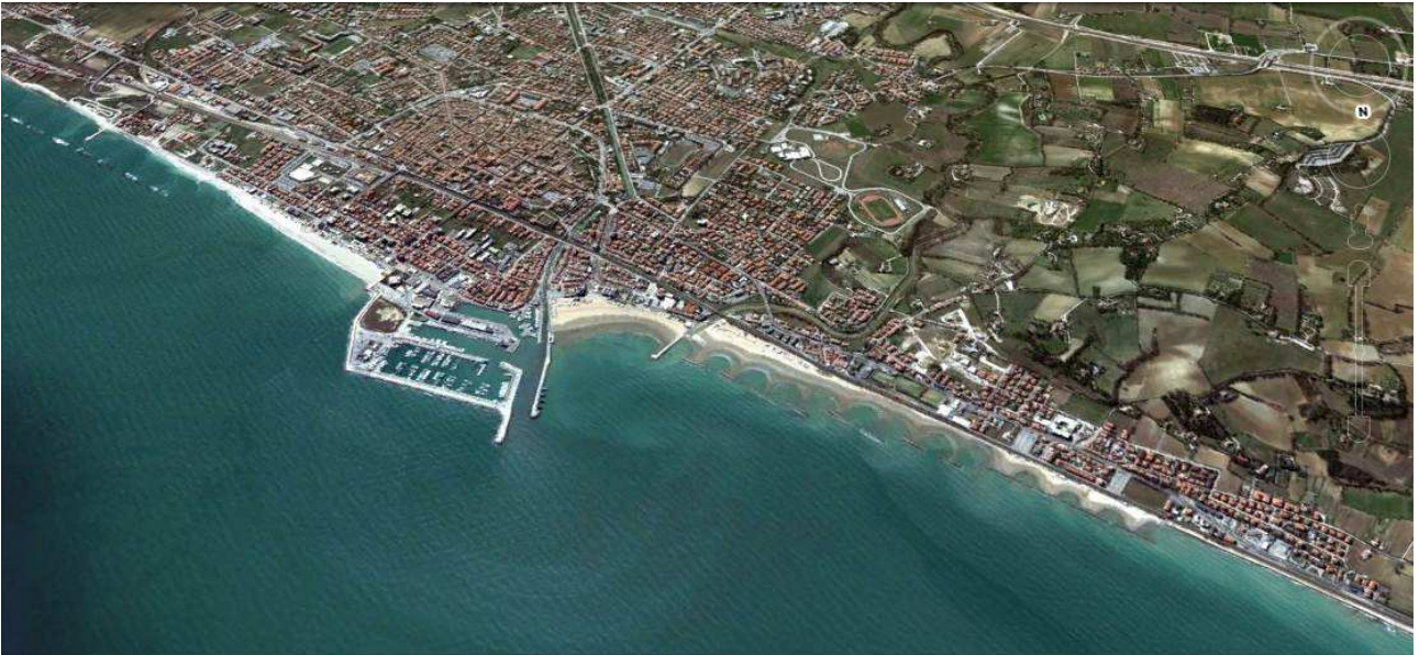
Fano from the sea / Fano vista dal mare

Noi consoli di Fano e tutto il popolo fanese con i nostri successori [...] [promettiamo] che saremo fedeli a Dio e al beato Marco apostolo ed evangelista e a voi nostro signore Pietro Polani gloriosissimo doge di Venezia, Dalmazia e Croazia; e allo stesso modo giuriamo fedeltà ai vostri successori che verranno dopo di voi, come fanno gli abitanti di ciascuna delle città [cioè vici ] e confinia di Venezia [...] fatti salvi gli obblighi che abbiamo verso il re di Germania.