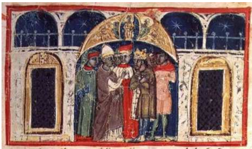
The peace of Venice, agreed in the Basilica of saint Mark between the pope (left) and the emperor (right), with the doge as mediator (centre) / La pace di Venezia, conclusa nella Basilica di san Marco tra il papa (a sinistra) e l'imperatore (a destra) con il doge come mediatore (al centro)

La pace di Venezia fu seguita nel 1183 dalla cosiddetta pace di Costanza. Si tratta in realtà di una legge imperiale emanata in forma di costituzione, dove si dichiara che l'imperatore concede ai Comuni della Lega il diritto di continuare a vivere secondo le loro antiche consuetudini: il che equivale a riconoscere in effetto il loro potere di autogoverno tramite Consigli e magistrati eletti a norma degli statuti, dietro mera ricognizione formale della supremazia dell'imperatore.