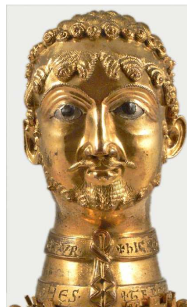
Bust of Frederick I Hohenstaufen, gilded bronze, ca. 1160, Cappenberg, Westphalia, Church of saint John the Evangelist / Busto di Federico I Hohenstaufen, bronzo dorato, ca. 1160, Cappenberg, Westphalia, chiesa di san Giovanni Evangelista

Such a development clearly made a dent in the feudal system of government, all the more so as the bishops often took the side of the cities in denying the supremacy of the Empire and the feudal rights to levies and duties from the cities. The question came to blows with emperor Frederick I Barbarossa Hohenstaufen (1122-1190, king of Germany and Italy since 1152, emperor since 1155).