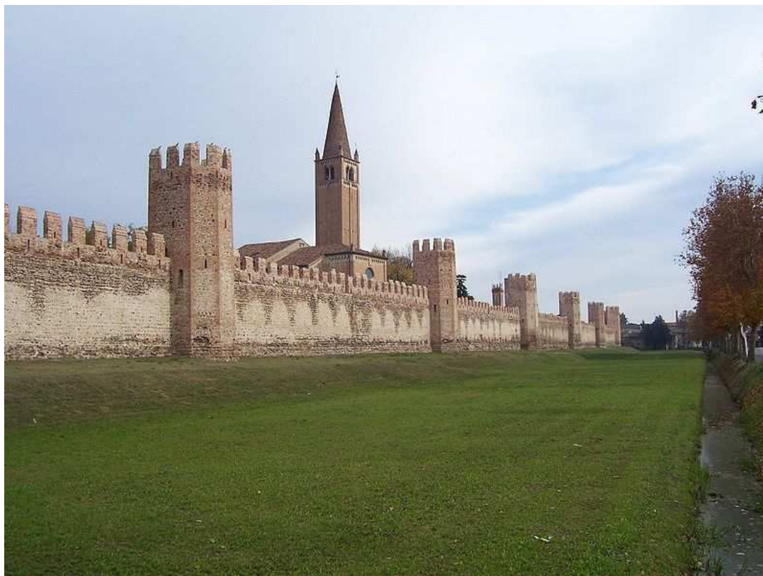
The walled town of Montagnana, Veneto / La città murata di Montagnana, Veneto

The question was debated through peace and war by pope Gregory VII (Ildebrando Aldobrandeschi di Soana, ca. 1025-1085, pope since 1073), emperor Henry IV (1050-1106, emperor since 1056) and their successors, and was settled in 1122 in the Worms agreement: the bishops were to be first invested of the ecclesiastical office by the pope, and only then of secular powers by the emperor.